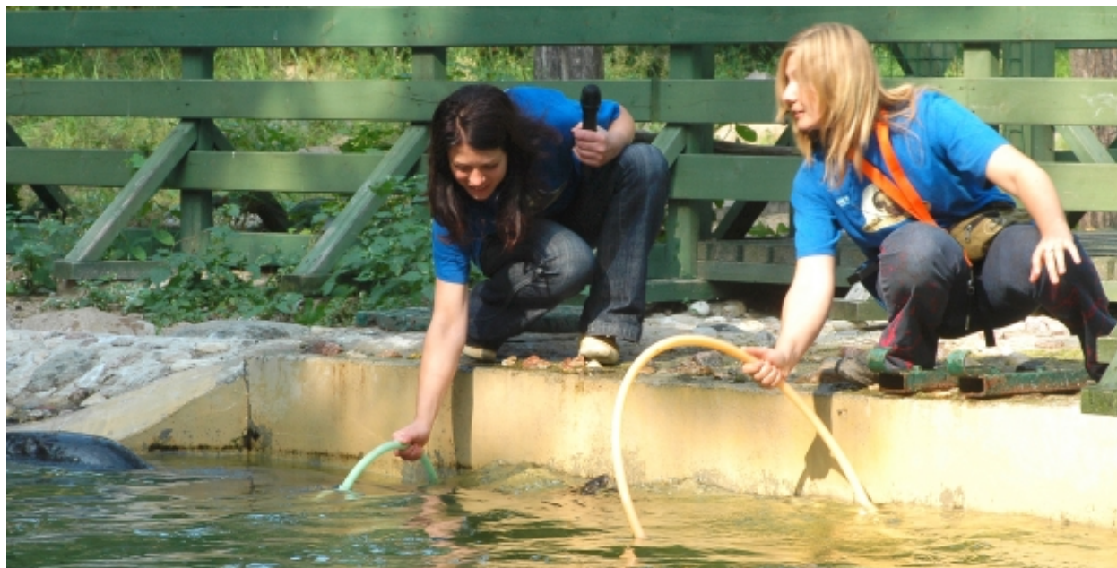
Kopā ar Daci: roņa peldināšana cauri diviem vingrošanas riņķiem

Šauriņš E. 1982. Latvijas zīdītājdzīvnieki. Rīga: Zvaigzne. ( Sugas apraksts, dzīvesveids. )