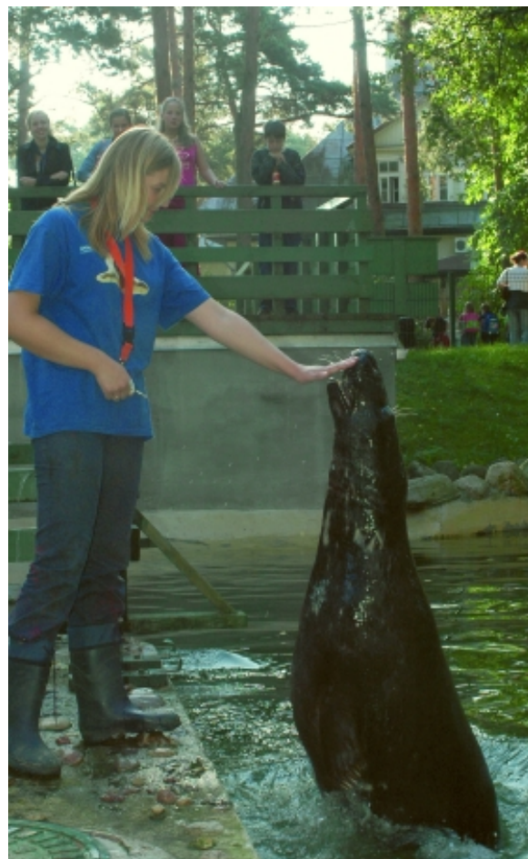
Lēcieni pie trenera rokas