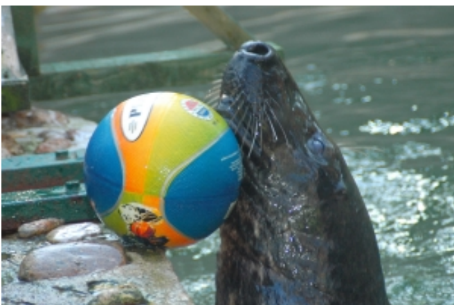
Lielās bumbas iznešana krastā ("caurā bumba")