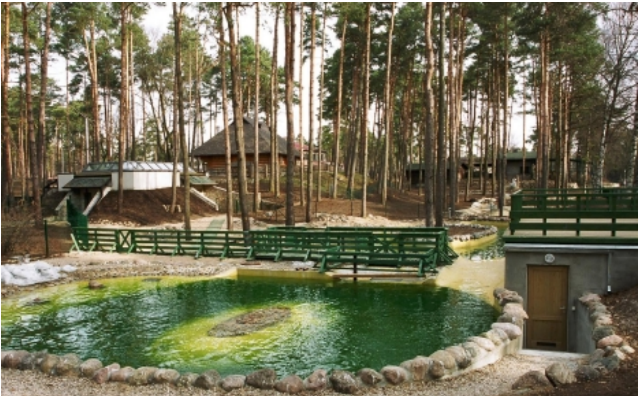
2002. gadā Rīgas zoodārzā atklātais roņu komplekss

Abus baseinus vienu no otra var atdalīt ar 80 cm augstu žogu.