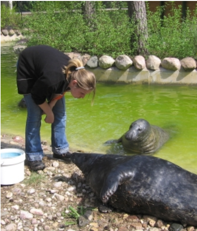
Roņu konkurence: leviņš pirmais iznācis krastā ripināties

Sākumā leviņš Puikam peldēja līdzī, vēlāk – kad Puika bija ūdenī izsviesto objektu paņēmis un nesa krastā, leviņš viņam sāka kost pakalējās pleznās. Gadījās arī, ka Puika mantiņu izmeta un sāka ar leviņu villoties. Galu galā Puika gan objektu vienmēr iznesa. Rudens beigās leviņu atdalījām blakus baseinā, lai nebūtu traucējumu treniņu un šovu laikā; tas gan bija iespējams tikai periodā, kad neviens no abiem baseiniem netika mazgāts.