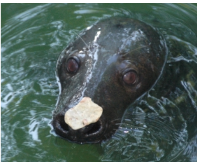
Ja nevar atrast iznesamo objektu, krastā var iznest akmentiņu!

kad saņēma uzdevumu ar tārgetu un lēcienā atjēdzās, ka lec nevis pie tārgeta, bet jau plaukostas, sabijās, uzreiz metās prom un paslēpās ieniris ūdenī. Kad bija pieradis pie rokas, tārgets vairs nebija nepieciešams. Uzdevumu iemācījās apmēram 7 dienās.