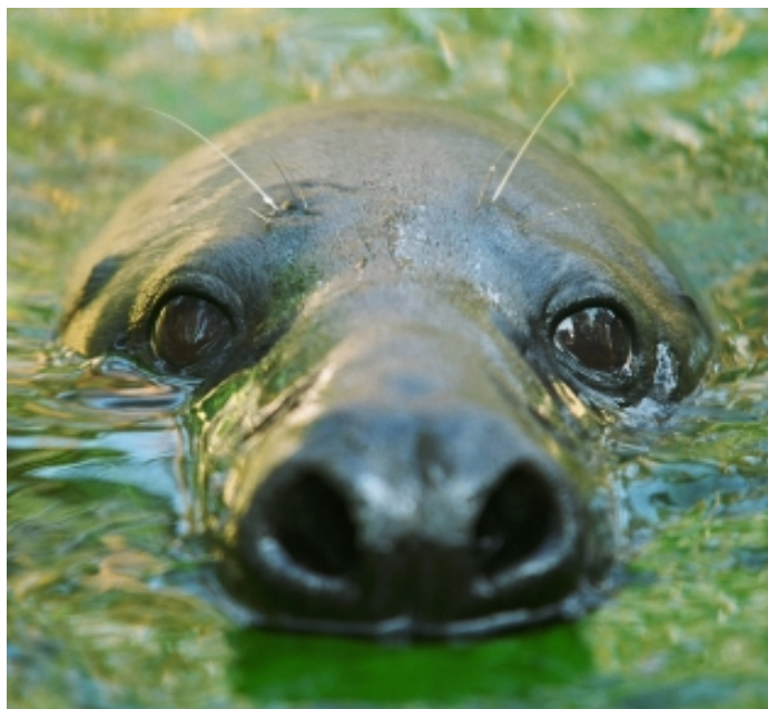
Puika – Rīgas zoodārza trenētais pelēkais ronis

Vērtē, ka 20. gs. sākumā Baltijas jūrā bijis 80–100 tūkstošu pelēko roņu, bet gadsimta beigās – vairs tikai 5–7% no šī daudzuma (tikai daži tūkstoši). Tagad skaits sācis atkal palielināties.