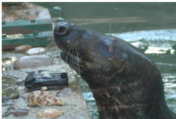
Piedzīvojumi ar mobilo telefonu: iznešana no ūdens uz deguna...