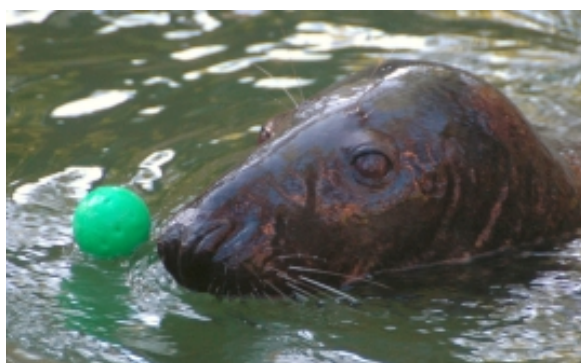
Plastmasas kauliņš un grimstošā bumbiņa