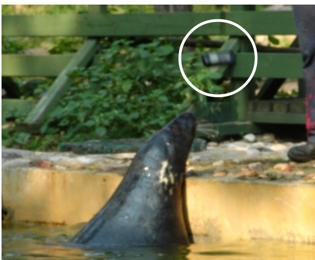
...vai vienkārši telefona izmešana krastā