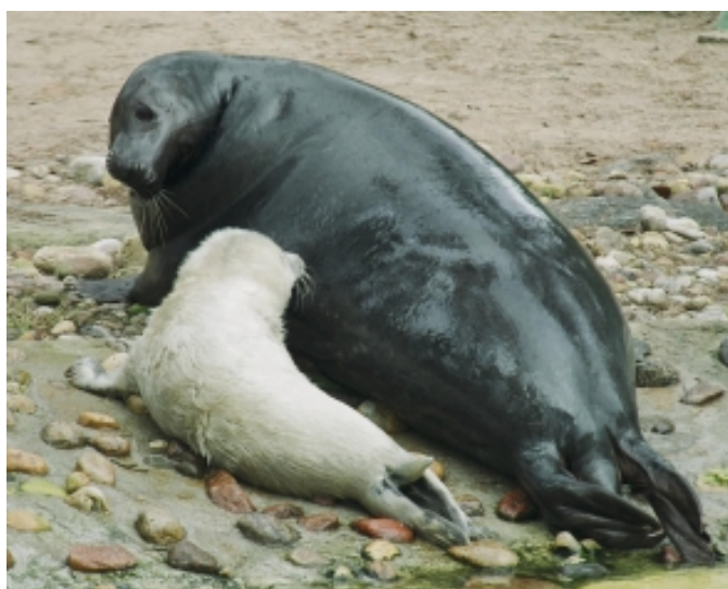
Eze ar 2004. gada ronēnu