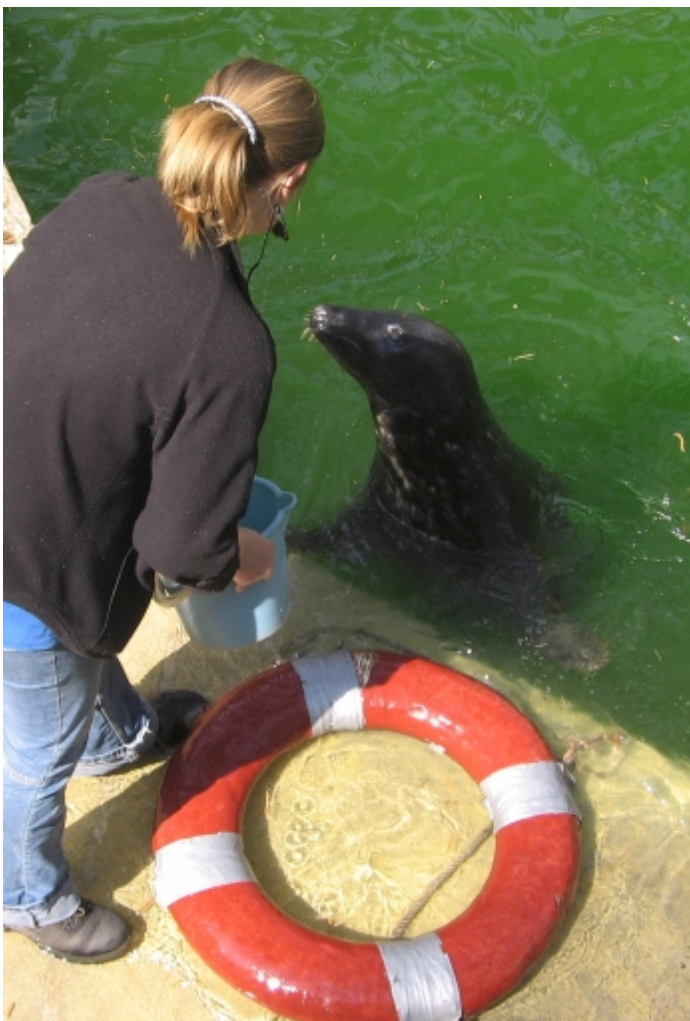
Roņu šova laikā Rīgas zoodārzā