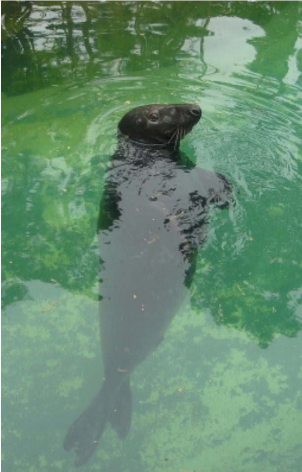
Puika pārdomu brīdī...